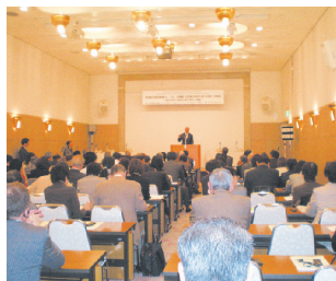
日独消費者フォーラム

私たちはCI（国際消費者機構）の一員として世界の消費者団体と連携しています。日独消費者フォーラム等を開催し、世界の消費者問題や消費者行政のあり方などについて認識共有を図っています。