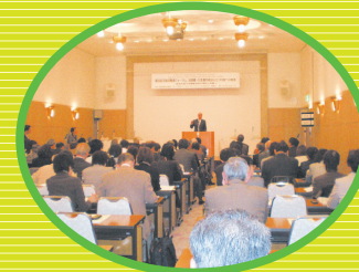
2010年3月3日～4日 第3回日独消費者フォーラム