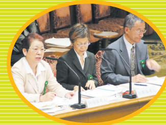
2009年5月7日 参議院（消費者問題に関する特別委員会）