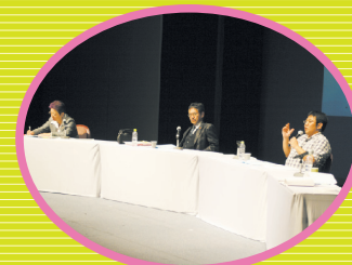
2009年11月18日～19日 第48回全国消費者大会

全国消団連は、消費者庁、ベルリン日独センター、フリードリヒ・エーベルト財団とともに第3回日独消費者フォーラム「消費者・生活者の視点に立つ行政への転換」～日独両国の消費者政策の現状と課題～を開催しました。