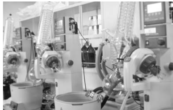
●野菜の残留農薬分析マシン