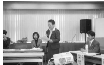
●今後の取り組みに期待を込めて開会挨拶