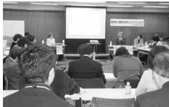
●時間が足りないほど議論は白熱