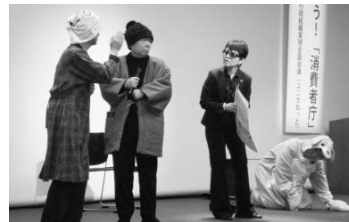
●熱のこもった演技に拍手喝采