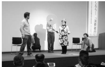
●リコールされたはずのハロゲンヒーターは？